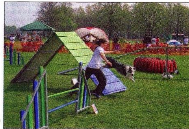
Le jumping canin promet un spectacle spectaculaire et haletant

Samedi 4 et dimanche 5 juillet, lycée agricole de Cibeins.